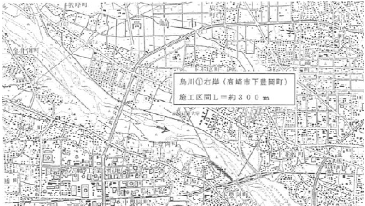
平面図 (縮尺: 1/25,000)